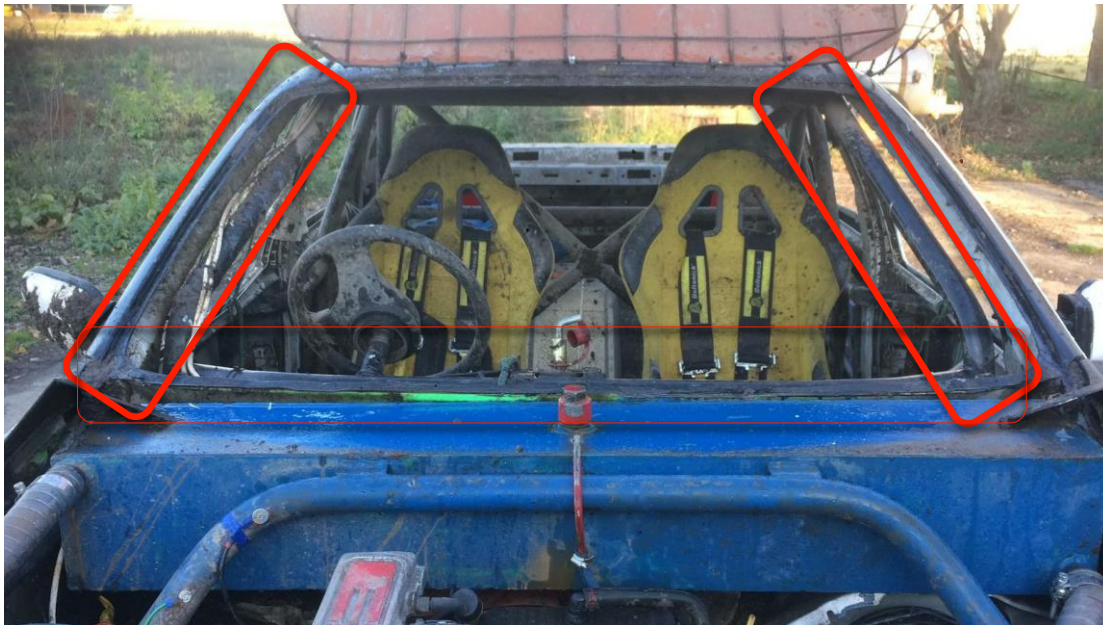
Figuur 2. Rolkooi afsteuning naar voren.